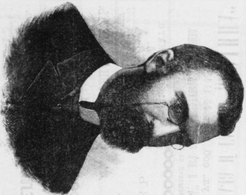
Генеральный комиссаръ всероссійской выставки 1896 г. въ Нижнемъ-Новгородѣ В. И. Тимирязевъ. «Родина», 1895 г., № 26.

Въ «РОДИНѢ» припимають участие лучшіе русскіе писатели и художники.